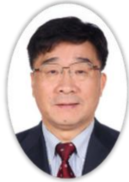
刘伟 ，教授，现任中国人民大学校长